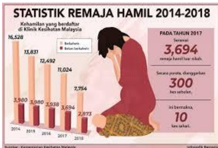
Rajah 1: Sumber